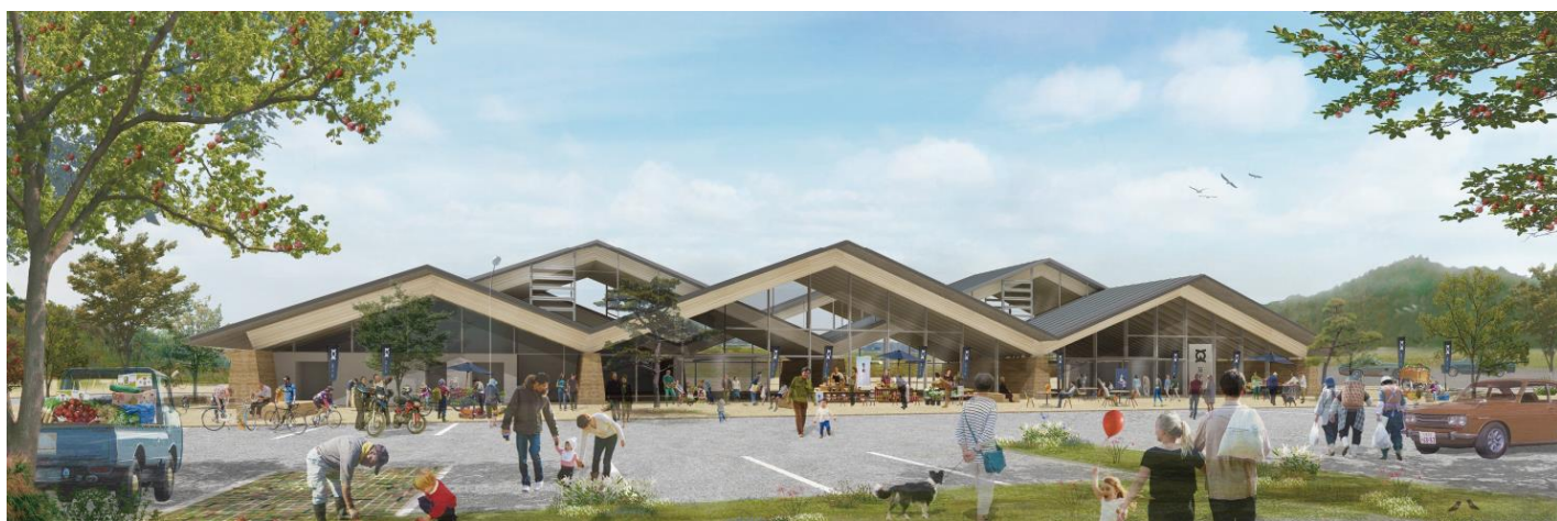
道の駅施設外観イメージ

現在、国土交通省へ道の駅の認定申請中の益子町地域振興拠点施設整備事業のオープン日が決まりました。今後は、内覧会など詳細なスケジュールが決まりましたら随時お知らせしていきたいと思っております。