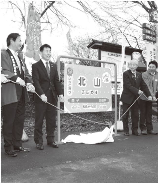
「いちごの駅北山」駅名標除幕式の様子