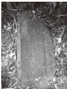
▲二十三夜供養塔兼道標

益子町では根本山の山裾を南北に通る街道を今もタツ街道とよんでいます。東田井町営住宅南のY字路には寛政7年(一七九五)の二十三夜供養塔兼道標があり、「左くげたつくば道/右さいみやうじきつれがわ道」と刻まれ、当時の面影を今に伝えています。