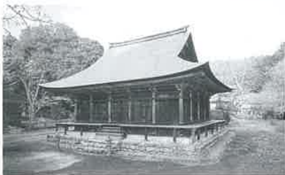
▲地蔵院本堂 建久5年(1194年)の創建と伝えられ、側柱が角柱、内部は円柱とし阿彌陀堂式の平面を構成しています。国指定重要文化財。