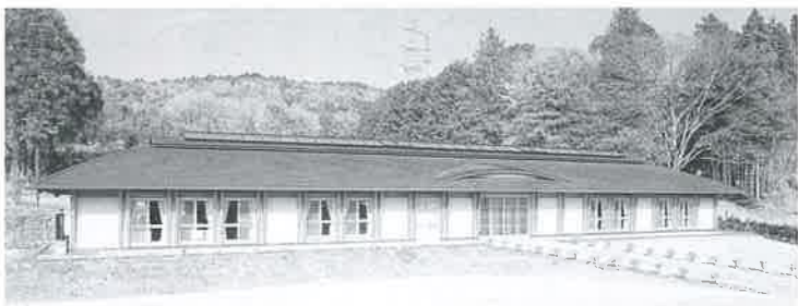
▲尾羽の里交遊館 「尾羽の里交遊館」は、周辺地域に残る歴史的資源や自然景観の環境保全整備を含め、都市と農村の交流及び地域の住民活動の拠点施設です。