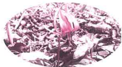
カタクリ(3月下旬~4月中旬)