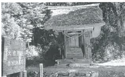
▲大倉神社 大同2年(807年)の創建と伝えられています。本殿は一間社流造り、茅ぶき屋根で国指定重要文化財です。