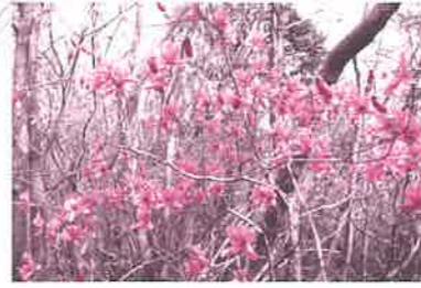
トウゴクミツバツツジ