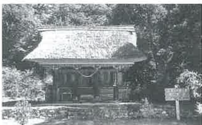
▲網神社 建久5年(1194年)宇都宮朝綱が創建したもので、国指定重要文化財です。