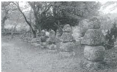
▲宇都宮家の墓 宇都宮城主累代の墓で、三代城主朝綱が地蔵院に隠棲して、後ここに墓所を定め初代宗円、二代宗綱の墓を築いてから三十三代政綱に至るまで代々埋葬されています。県指定文化財。