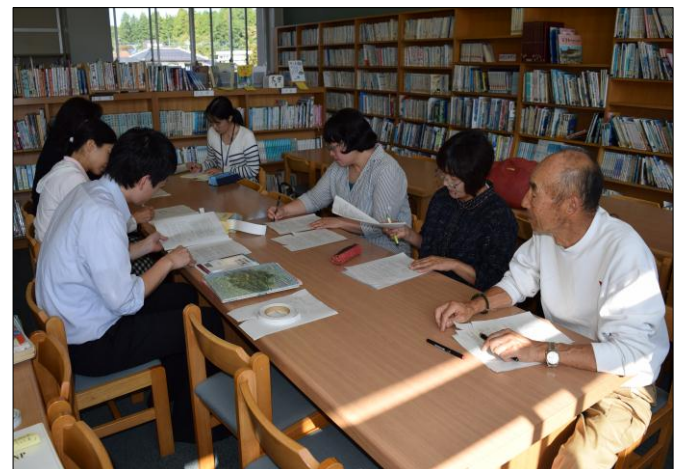
〈写真：図書ボランティア研修会の様子〉

本校では、図書整理、家庭科の裁縫・ミシン、読み聞かせ、昔遊びなどで多くのボランティアの方々にお世話になっています。3年総合「町の名人を探そう」の授業では、塙・星の宮の宝を育てる会の方が、夏休みのワークショップの説明や実演をしてくださり、子どもたちの関心が大きい高まりました。また、夏休み期間に、竹トンボ作り、フラワーアレンジメント、雨巻山登山などの講座を開いてくださり、子どもたちは様々な活動を体験することができました。これからも地域の方々と協力しながら、充実した活動になるようにしていきたいと思っております。