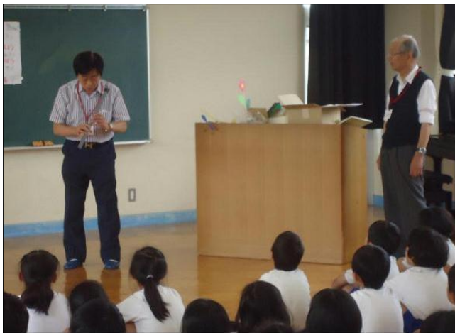
〈写真：3年総合におけるワークショップの説明の様子〉