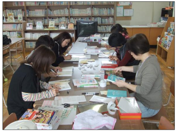
〈写真：図書ボランティアのみなさんの活動の様子〉

本校の学校支援ボランティアの組織は、4名のコーディネーターを中心に、「読み聞かせボランティア」「図書ボランティア」「家庭科ボランティア」「付き添いボランティア」の年間登録者で構成されています。平成27年度の登録者は28名です。その他に、生活科や総合的な学習の時間では、たくさんの方々に地域の先生として、協力をいただいています。また、校外学習の付き添いボランティアとして、登録されていない方も含めて、延べ30名の方々に、児童の安全確保に協力していただきました。今年も、職員のニーズをもとに、2月にボランティアを募集し、組織作りをした上で、4月から活動を始める予定です。